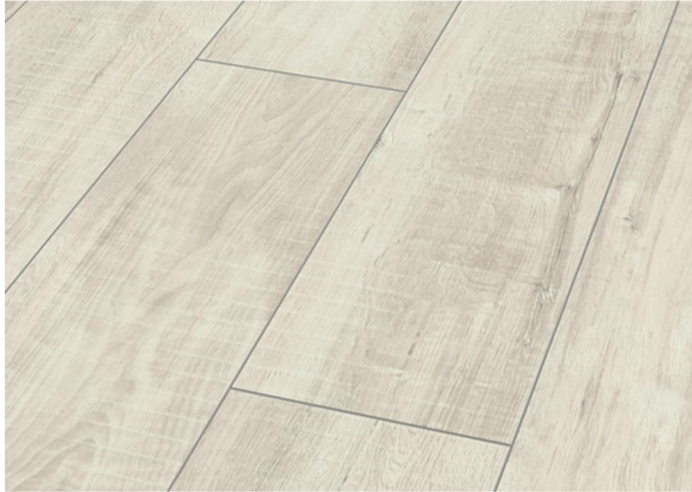
Blanco Oslo D9005