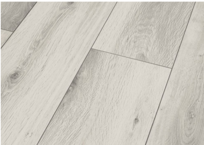
Gris Kiev D9007